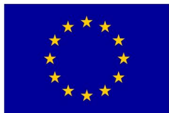
Euroopa Liit Euroopa Sotsiaalfond